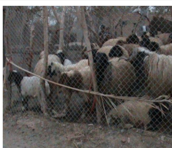
شكل-1: مجموعة من الأغنام المفحوصة

138 عينة دم من الحيوانات (70 عينة من الأغنام و 68 عينة من الأبقار) كانت نسبة الإصابة 41.30 % واطهر التحليل الإحصائي فروقاً معنوية بين عينات دم النساء الحوامل والذكور ( p < 0.05 ).